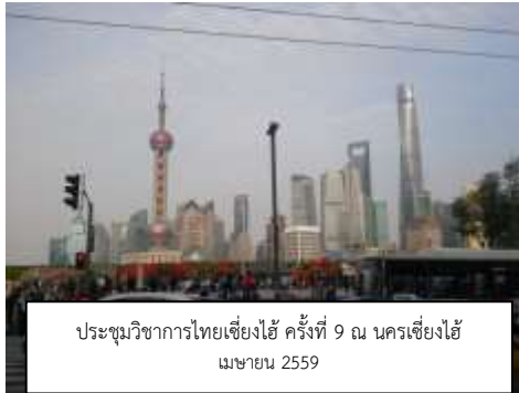
ประชุมวิชาการไทยเชียงใหม่ ครั้งที่ 9 นครเชียงใหม่ เมษายน 2559